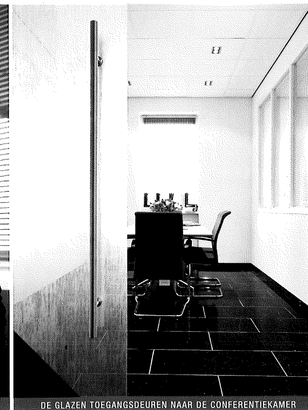
DE GLAZEN TOEGANGSDEUREN NAAR DE CONFERENTIEKAMER

voorbeeld een uitbouw willen laten plaatsen, kunnen ze hier beleven hoe het eruit komt te zien. Niet met tekeningen of folders, maar met nagebouwde projecten, compleet afgewerkt en ingericht. Op die manier kunnen ze de nieuwe situatie beter visualiseren.'